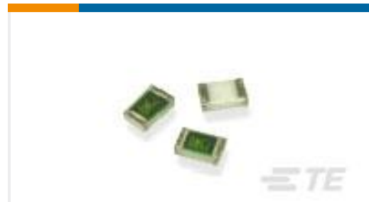
TE 产品编号1676336-1 RN 0805 412R 0.1% 10PPM CUT LENGTH