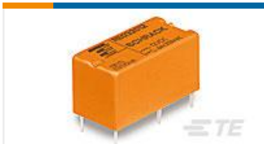
TE 产品编号2-1416010-4 RE034006