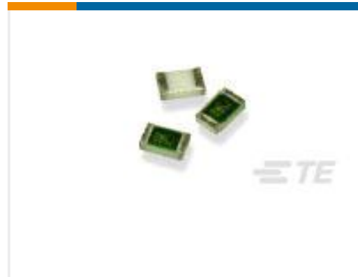
TE 产品编号8-1676481-4 CPF 0603 24K 0.1% 25PPM 1K RL