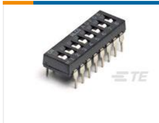
TE 产品编号1-1825059-2 ADF03STTR04=DIP S, FLUSH, SMT-GW