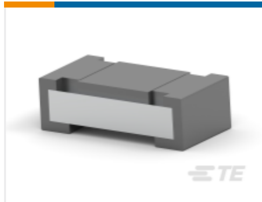
TE 产品编号1-2176057-7 厚膜电阻器：电流感应