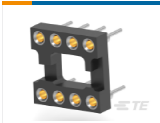
TE 产品编号1-2199300-2 DIP Socket: Standard, Stamped & Formed, Open, Tin