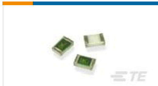
TE 产品编号2-1614351-7 RN 0603 1K87 0.1% 10PPM CUT LENGTH