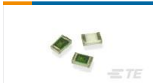
TE 产品编号1-1614352-3 RN 0603 22K1 0.1% 10PPM CUT LENGTH