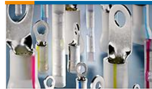
TE 产品编号53963-1 TERMINAL, PIDG PVF2 R 16-14HD 4