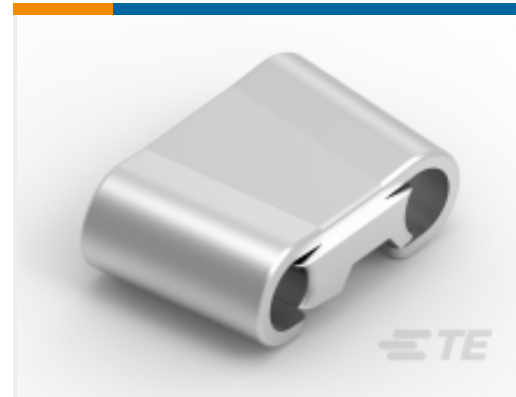
TE 产品编号1443209-1 CONNECTOR, 1351 KC MIL-636