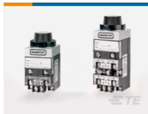
TE 产品编号7-1423162-5 7022ACX=RLY, STD, OFF, 2P, 120VAC, 15SEC, X OP