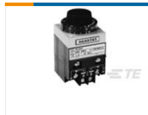
TE 产品编号1423157-3 7012ABL=RLY, STD, ON, 2P, 120VAC, 15SEC, X OP