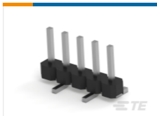
TE 产品编号2842102-4 4P,2MM,BRK HDR,SRVT,SMD,0.1AU, TR W/CAP