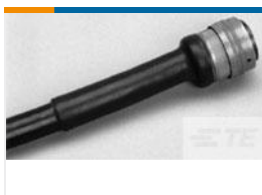
TE 产品编号5110552003 ATUM-8/2-0-STK