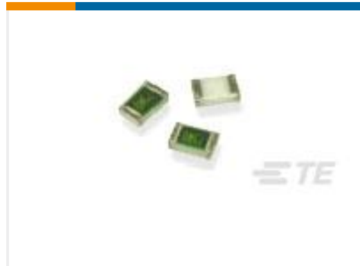
TE 产品编号3-1879130-2 RN 0402 3K4 0.1% 10PPM 1K RL