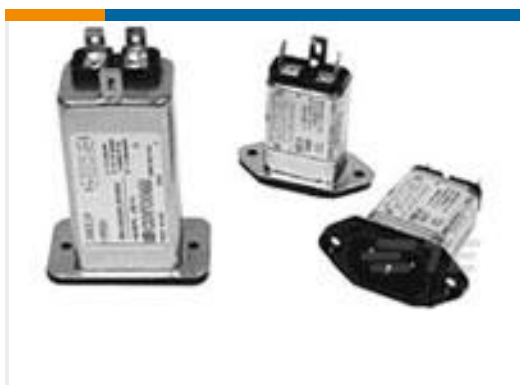
TE 产品编号3-6609006-3 3EEJ8=F8011