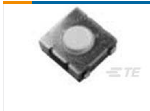
TE 产品编号1571626-6 TACT,SMT,GULL WING,160GF,T&R