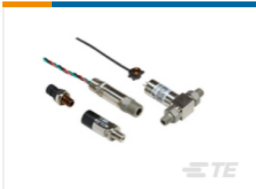
TE 产品编号10202026-00 压力传感器 (现货)