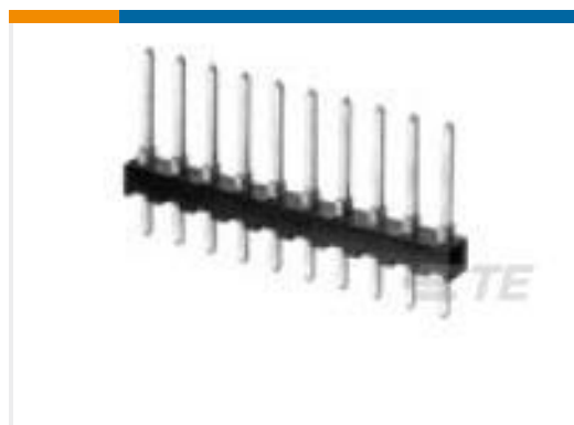
TE 产品编号1-825440-7 MOD 2 PINHDR 2X17P.