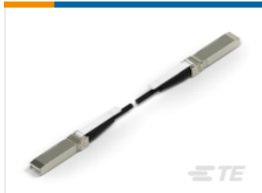
TE 产品编号2127932-3 28 AWG SFP+ 对 SFP+ I/O 电缆组件