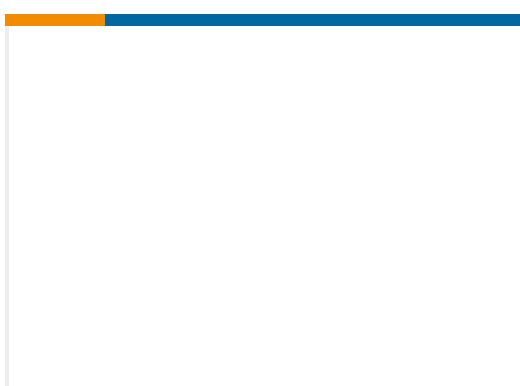
TE 产品编号G-NSDMG-036 NS-5/DMG2-CXD MOD2