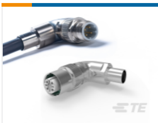
TE 产品编号1-2823587-4 M12 R/A 压接应力消除