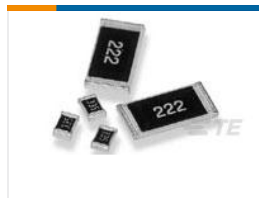
TE 产品编号1623158-1 CRG0805 1% 22R