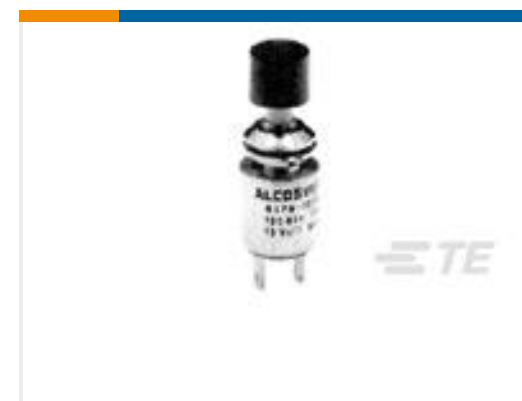
TE 产品编号1825538-3 MSPM101C104