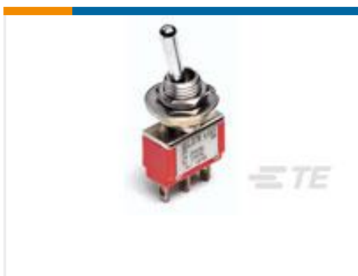
TE 产品编号1825139-4 A203P3ZQ04