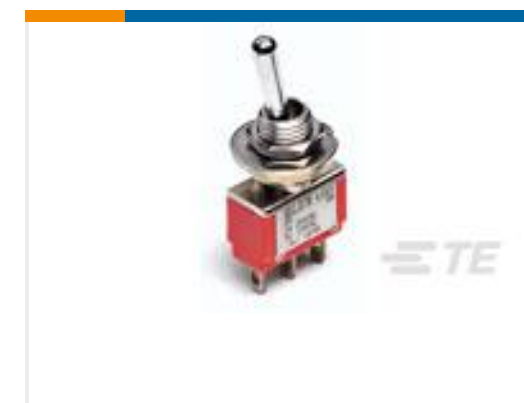
TE 产品编号1825138-3 A201KZQ04