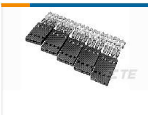
TE 产品编号103975-3 5X4 MTE RCPT SR PLAIN .100CL