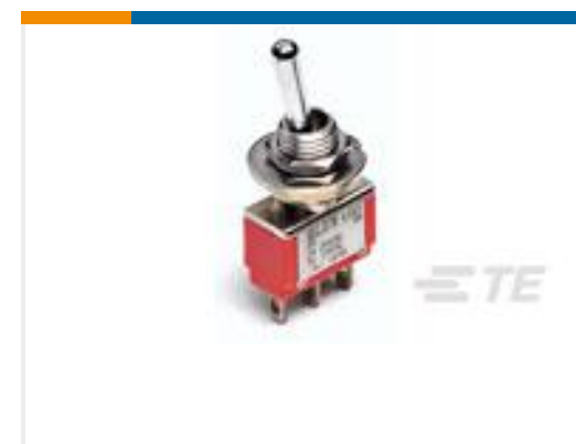
TE 产品编号1-1825138-5 A201P3ZQ04