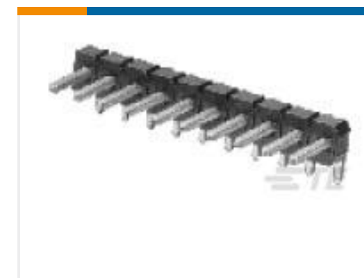
TE 产品编号103759-5 05 MODII HDR SRRA B/A .100CL