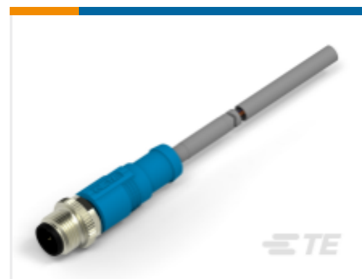
TE 产品编号T4161120005-005 M12 A 编码公端直式单端线束