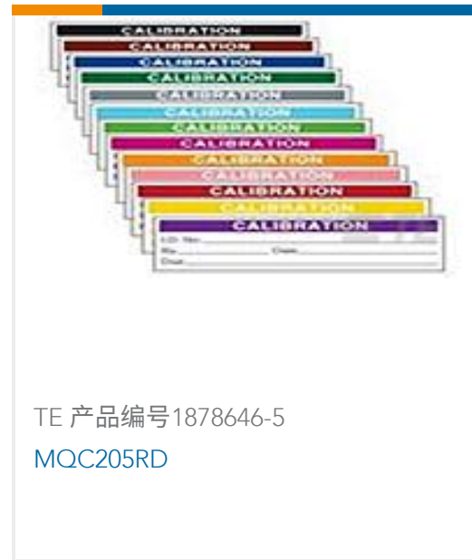
TE 产品编号1878646-5 MQC205RD