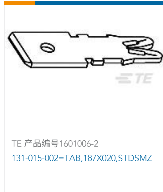
TE 产品编号1601006-2 131-015-002=TAB,187X020,STDSMZ