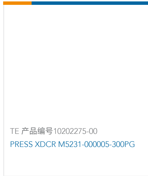
TE 产品编号10202275-00 PRESS XDCR M5231-000005-300PG