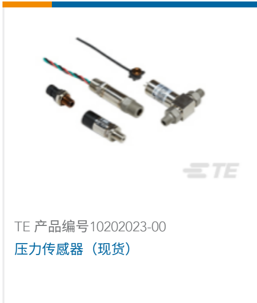
TE 产品编号10202023-00 压力传感器 (现货)