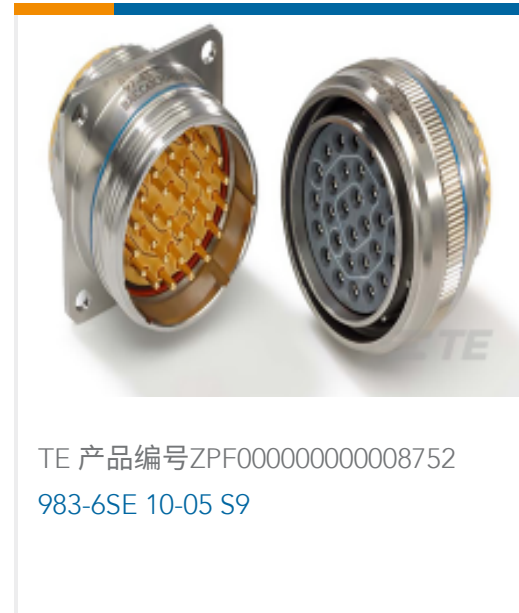
TE 产品编号ZPF000000000008752 983-6SE 10-05 S9