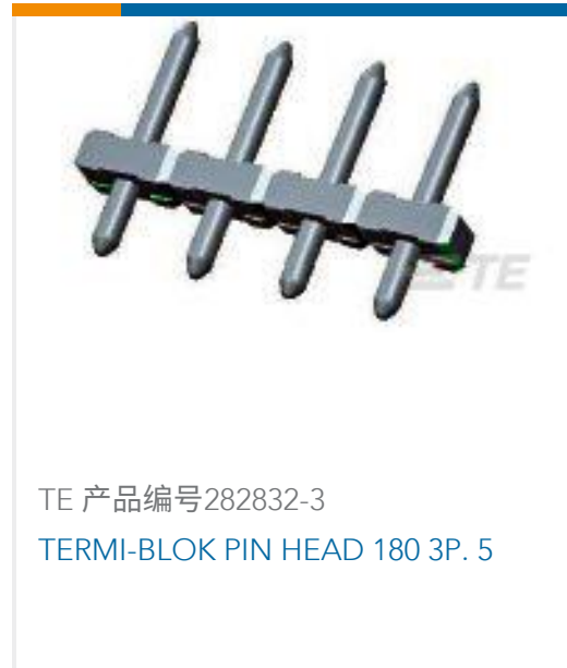
TE 产品编号282832-3 TERMI-BLOK PIN HEAD 180 3P. 5