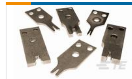
TE 产品编号2-456406-5 WIRE CRIMPER .090