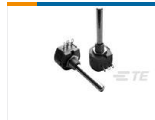
TE 产品编号1676979-4 TW 1W 10K 6.35X25PL