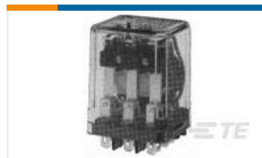
TE 产品编号2-1393117-4 KUP-11A25-120=KU