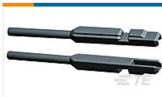
TE 产品编号1394871-1 MOS Dichtstopfen