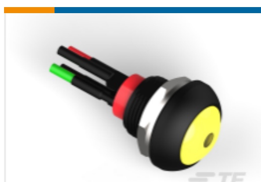
TE 产品编号1-2329389-1 PB OFF/ON FC YLW M1 TERM WHI LED IP68 50