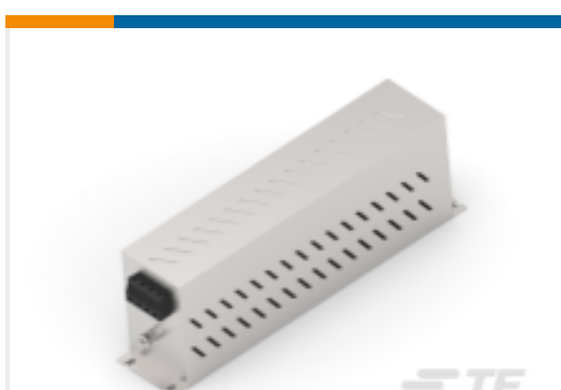
TE 产品编号2-1609998-3 KEV 42A 2S SP WYE BS 440VAC