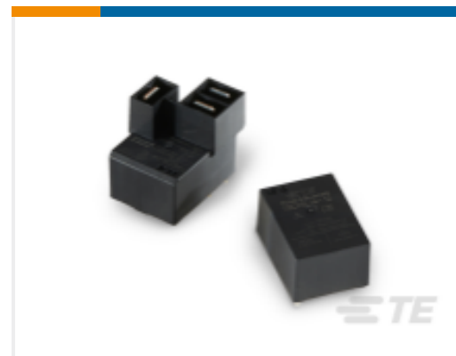
TE 产品编号1558670-7 PCB 功率继电器: 30 安培, 单稳直流