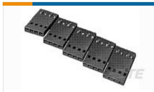
TE 产品编号104503-9 10 MTE PIN HSG SR RIB .100CL