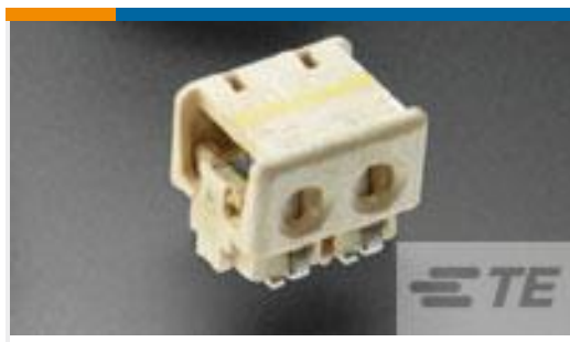
TE 产品编号1-2106003-4 Connector, SMT-IDC, 4 POS, 20 AWG