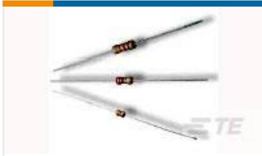
TE 产品编号2-1623933-3 CFR50 5% 3M9