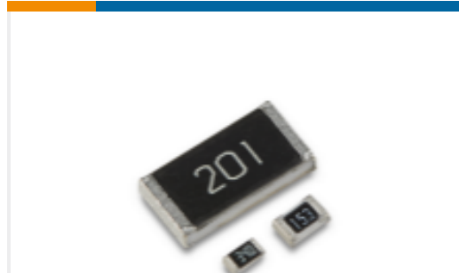
TE 产品编号2-2176325-8 CRGP 0402 1K8 1%