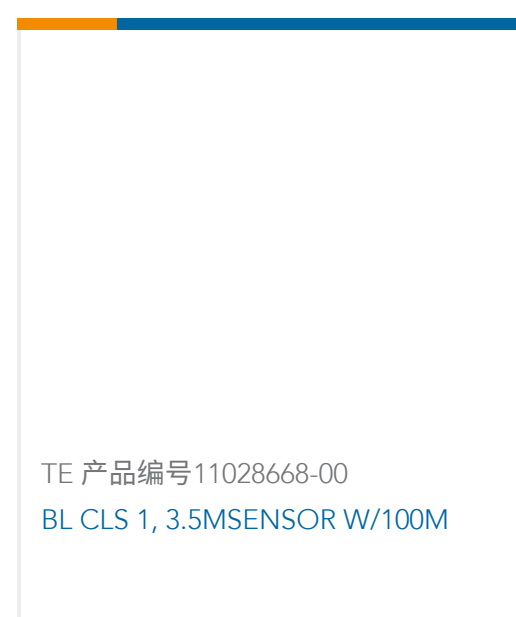
TE 产品编号11028668-00 BL CLS 1, 3.5MSENSOR W/100M