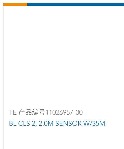
TE 产品编号11026957-00 BL CLS 2, 2.0M SENSOR W/35M