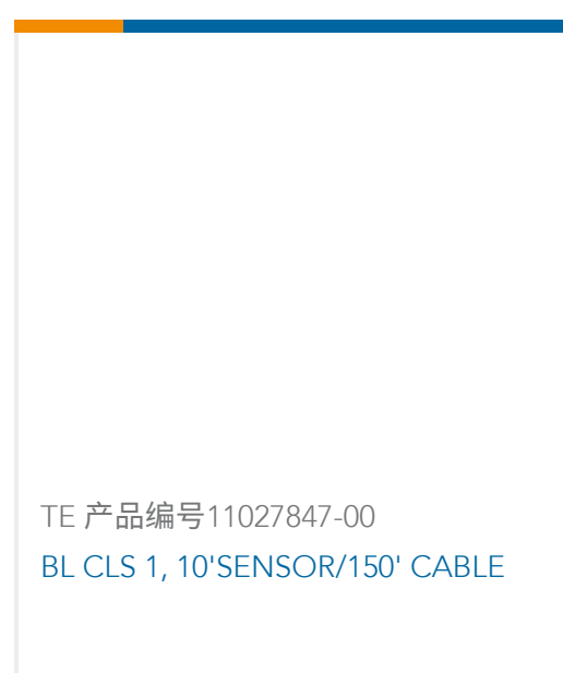
TE 产品编号11027847-00 BL CLS 1, 10'SENSOR/150' CABLE