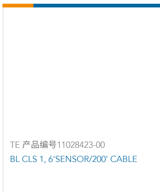
TE 产品编号11028423-00 BL CLS 1, 6'SENSOR/200' CABLE