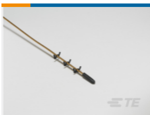
TE 产品编号11028376-00 压电流量传感器