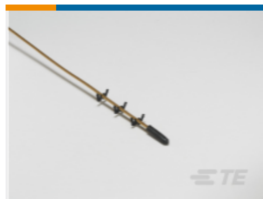
TE 产品编号11026541-00 压电流量传感器