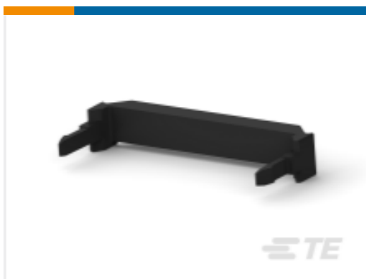
TE 产品编号1-499252-0 总线连接器：应力消除，ATA