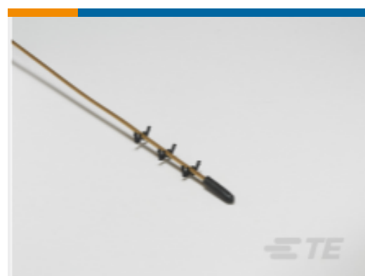
TE 产品编号11026278-00 压电流量传感器