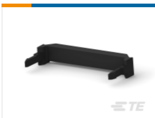
TE 产品编号1-499252-0 总线连接器：应力消除，ATA