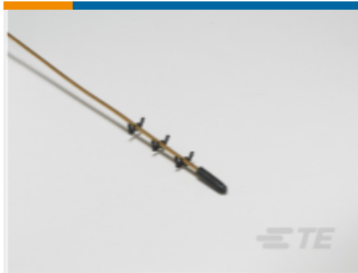
TE 产品编号 CAT-TRA0001 压电流量传感器