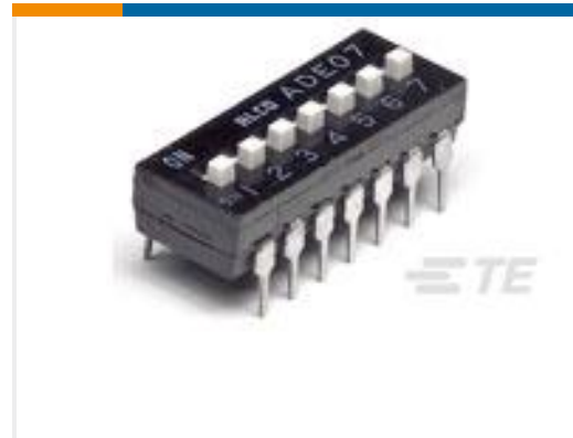
TE 产品编号1825057-4 ADE0504=DIP SWITCH,EXT,THRU/HL