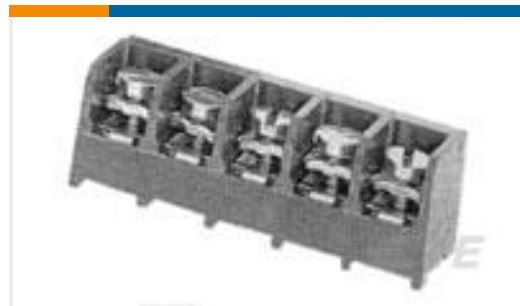
TE 产品编号1-1437653-4 6PCV-08-007=6PCV ASSEMBLY