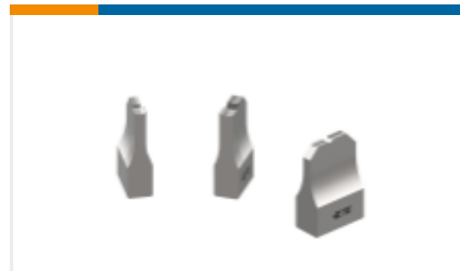
ANVIL REPRESENTATION ONLY