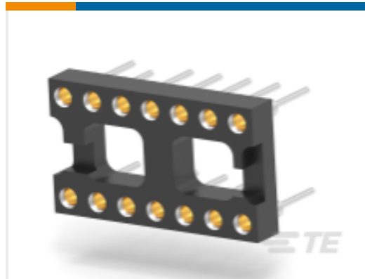
TE 产品编号2-1571552-9 DIP Socket: Standard, Stamped & Formed, Open, Gold