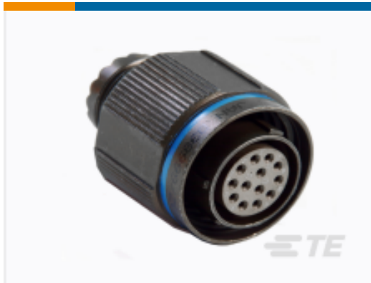
TE 产品编号YDTS26G11-99SAV001 D38999: 直式插头, 11-99 插件