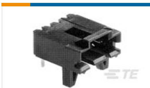
TE 产品编号103673-8 09 MTE HDR SRRA LATCH W/HLDWN