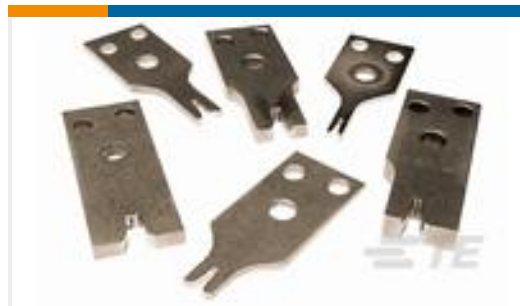
TE 产品编号1-1633713-1 CRIMPER, WIRE PREMIUM .039