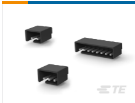
TE 产品编号2213738-2 回流功能经济型电源接头