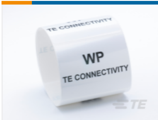
TE 产品编号E58363-000 WP 白色聚酯标签