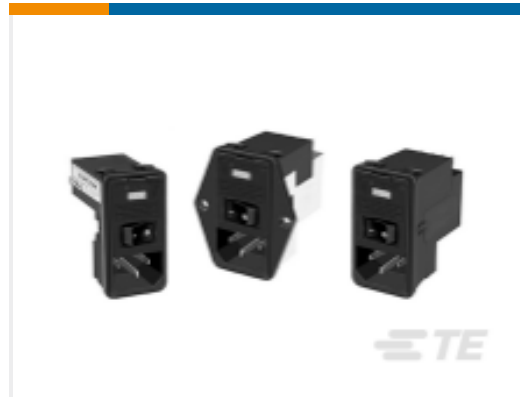
TE 产品编号3-6609929-2 CORCOM P 系列多功能插口式滤波器