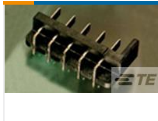
TE 产品编号5787141-1 HDR ASY,RA,RKEY,RET TAIL,7.2V