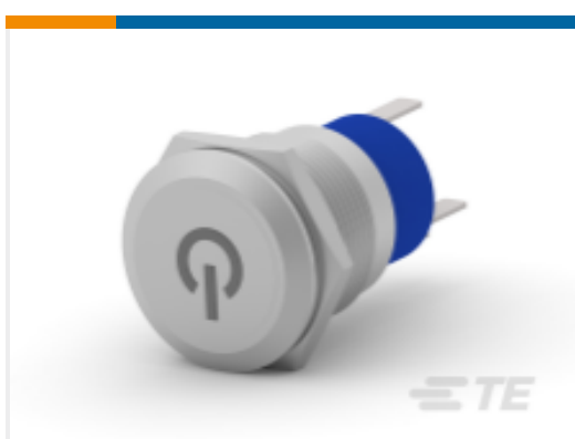
TE 产品编号2316366-3 AV19 SPM 3A POWER LOGO R&B 12V