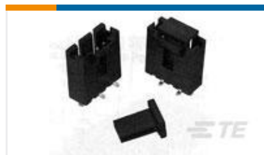
TE 产品编号5-1375583-9 10 MTE VERTICAL SMT HDR 30 AU