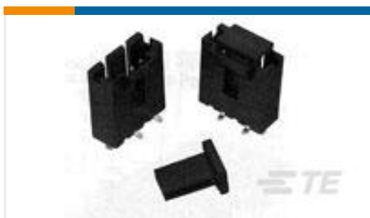
TE 产品编号1375583-9 10 MTE VERTICAL SMT HDR 30 AU