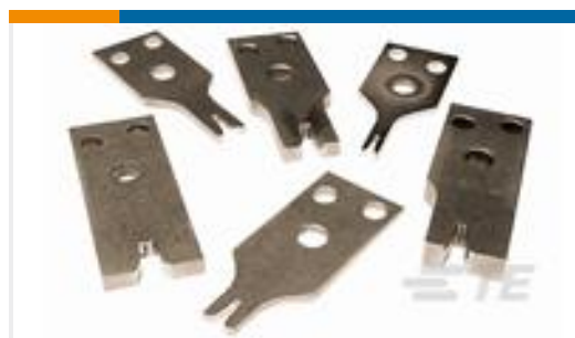
TE 产品编号2-1633609-9 CRIMPER, WIRE "F" (.078")