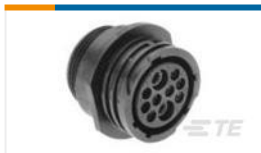
TE 产品编号213894-1 CPC RCPT, IN-LINE, SRS 6, 17-10