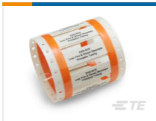
TE 产品编号EC9894-000 ZHD-SCE LFH 和耐流体性套管