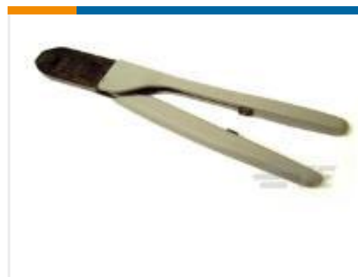
TE 产品编号91538-1 CCII TYPE II PIN SKT 30-20 ASSY