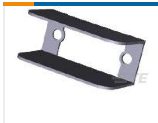
TE 产品编号201363-4 14 POS. PIN HOOD-CD. PL.