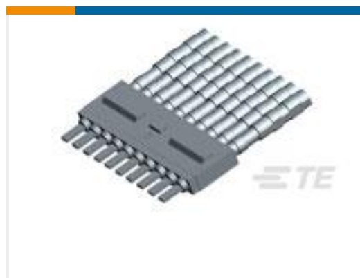
TE 产品编号697118-000 MTC100-JB1-P14