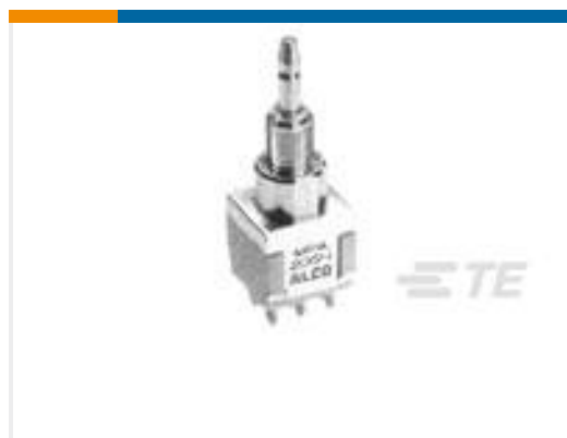
TE 产品编号3-1437567-1 MPA206N=SW P/B ON/OFF DPDT