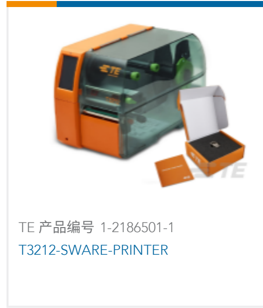
TE 产品编号 1-2186501-1 T3212-SWARE-PRINTER