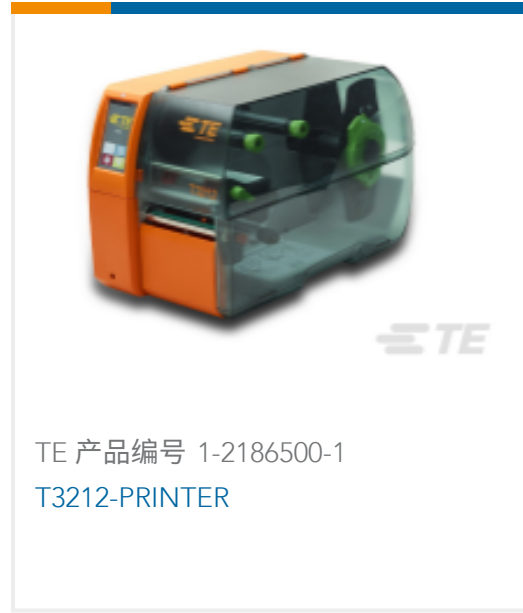
TE 产品编号 1-2186500-1 T3212-PRINTER