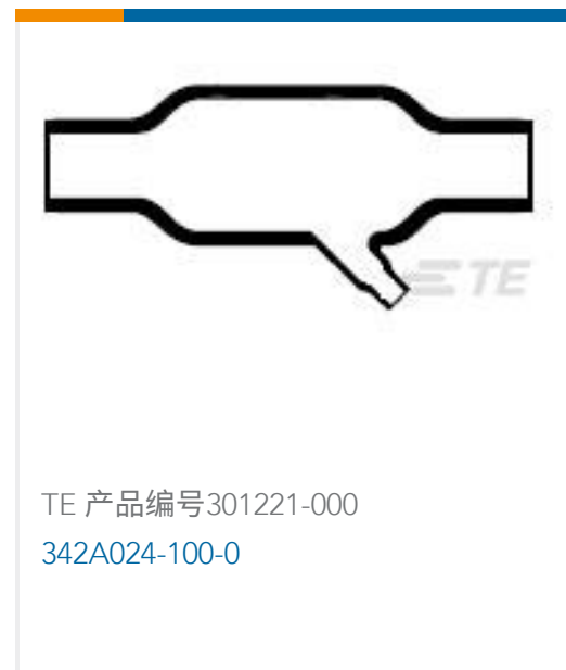
TE 产品编号301221-000 342A024-100-0