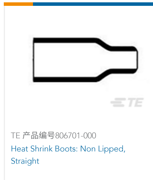
TE 产品编号806701-000 Heat Shrink Boots: Non Lipped, Straight