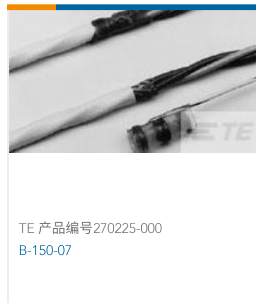
TE 产品编号270225-000 B-150-07