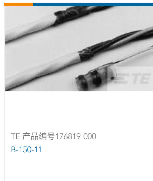
TE 产品编号176819-000 B-150-11