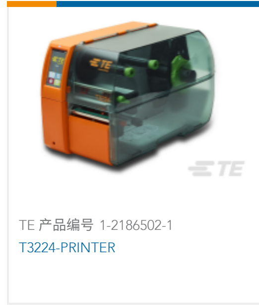
TE 产品编号 1-2186502-1 T3224-PRINTER