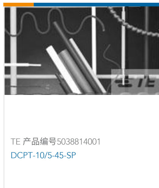
TE 产品编号5038814001 DCPT-10/5-45-SP