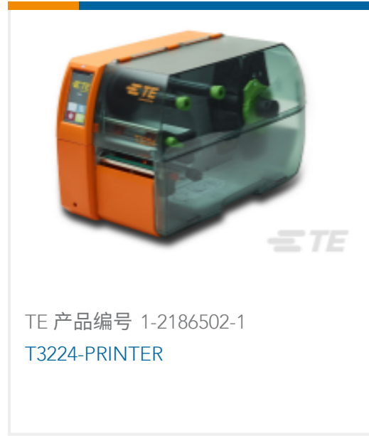
TE 产品编号 1-2186502-1 T3224-PRINTER