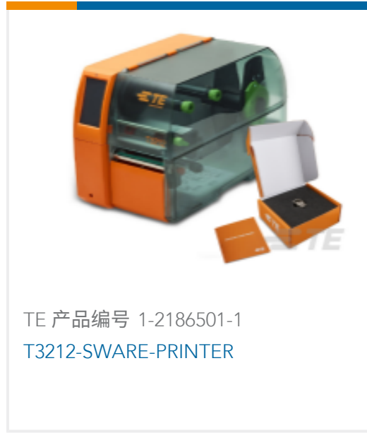
TE 产品编号 1-2186501-1 T3212-SWARE-PRINTER