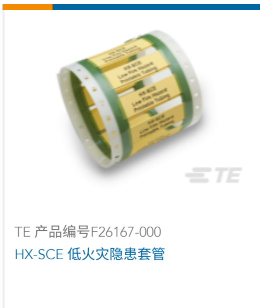
TE 产品编号F26167-000 HX-SCE 低火灾隐患套管