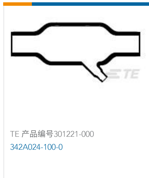
TE 产品编号301221-000 342A024-100-0