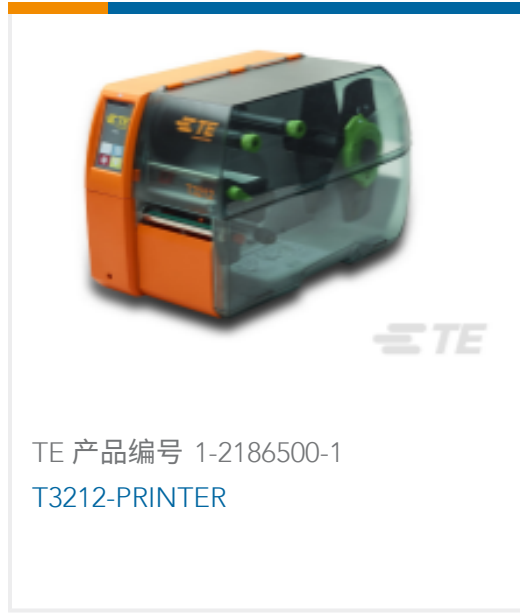
TE 产品编号 1-2186500-1 T3212-PRINTER