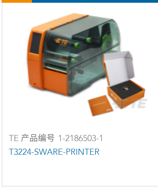
TE 产品编号 1-2186503-1 T3224-SWARE-PRINTER