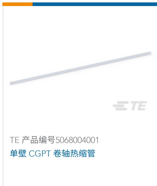
TE 产品编号5068004001 单壁 CGPT 卷轴热缩管