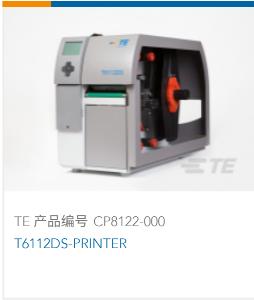
TE 产品编号 CP8122-000 T6112DS-PRINTER