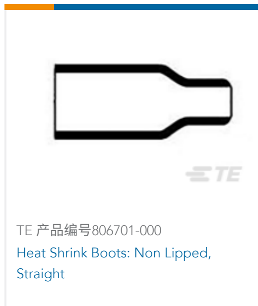
TE 产品编号806701-000 Heat Shrink Boots: Non Lipped, Straight