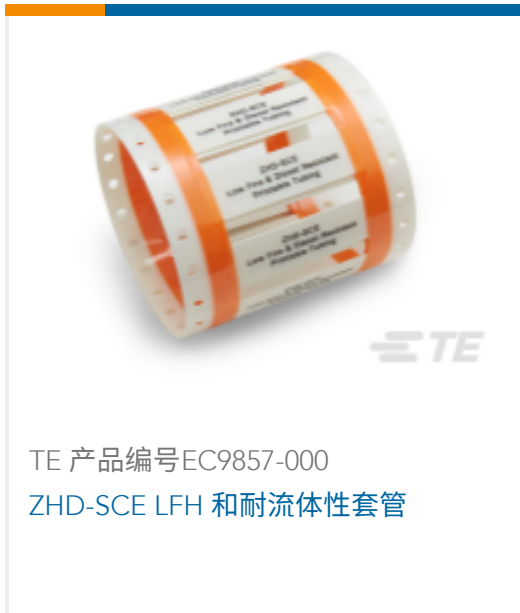
TE 产品编号 EC9857-000 ZHD-SCE LFH 和耐流体性套管