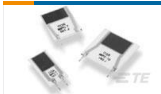
TE 产品编号 1-1623775-2 MPC10 500R 5%