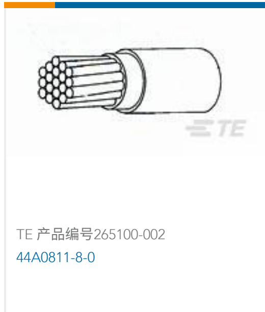
TE 产品编号 265100-002 44A0811-8-0