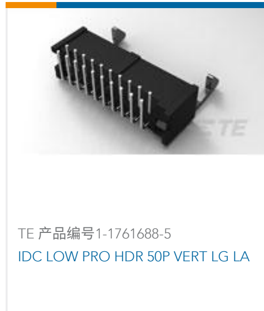
TE 产品编号 1-1761688-5 IDC LOW PRO HDR 50P VERT LG LA