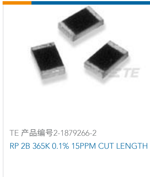
TE 产品编号 2-1879266-2 RP 2B 365K 0.1% 15PPM CUT LENGTH