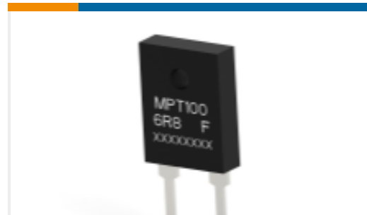
TE 产品编号 6-2176429-1 MPT100 330R 1%