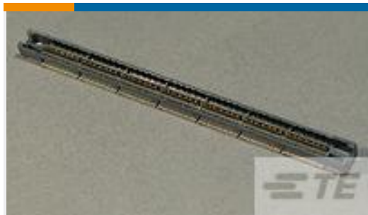
TE 产品编号 2-767004-8 MICT,RECPT,266,ASSY,.025,REC